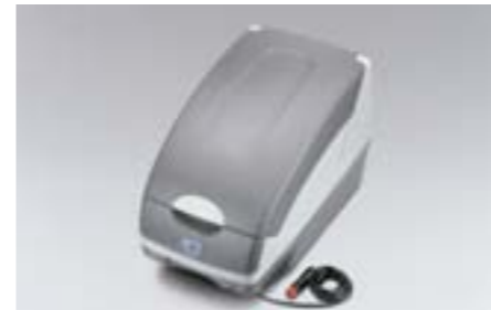
36 Glacière thermoélectrique SEWAYA1000 E Conserve au chaud ou au froid