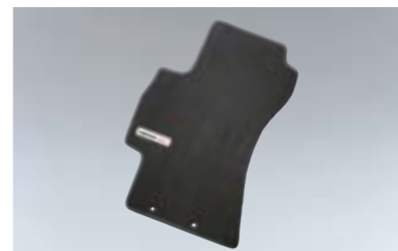
49 Jeu de tapis J505EFG300 W Tapis sur mesure avec logo aluminium *Jeu avant et arrière