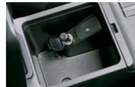
56 Kit fumeur H6710FG000 W

Réduit l'infiltration de poussière et de pollen dans l'habitacle. Pour un meilleur résultat, il est recommandé de le remplacer tous les ans ou tous les 15000 km *En remplacement du filtre d'origine