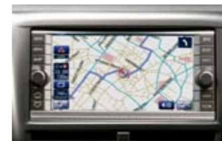
62 Kit Navigation H001EFG000 W Design exclusif, utilisation conviviale par le biais d'un écran tactile. Inclus : la radio, lecteur CD et DVD et pré-équipement kit mains libres *Le DVD de navigation doit être commandé séparément.