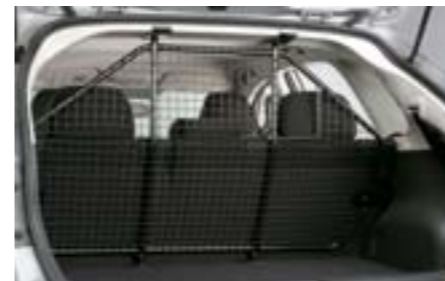
41 Grille de séparation en métal (G/M) F555EFG100 W Pour bien séparer le coffre des passagers arrières.