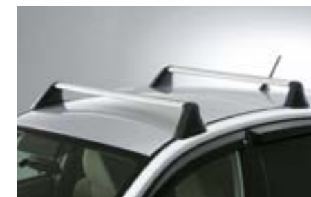
23 Barre de toit aluminium E3610FG500 W Barres profilées servant de base pour l'installation d'accessoires de portage