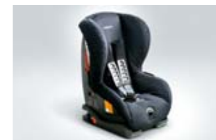
69 Siège enfant SUBARU Duo plus ISOFIX F410EYA002 W Installation sûre grâce au système ISOFIX