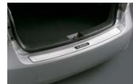
9 Seuil de pare-chocs arrière chromé E7710FG000 W Protège le dessus du pare-chocs des rayures