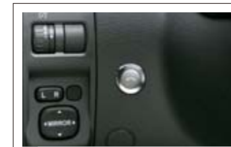
59 Kit mains libres téléphone blue tooth SEDEFG6000 E

Kit mains libres à commande vocale *Uniquement pour les véhicules ne possédant pas la navigation d'origine