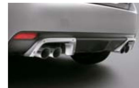
11 Entourages sorties d'échappements E7710FG030 W Extension aluminium pour un look plus sportif