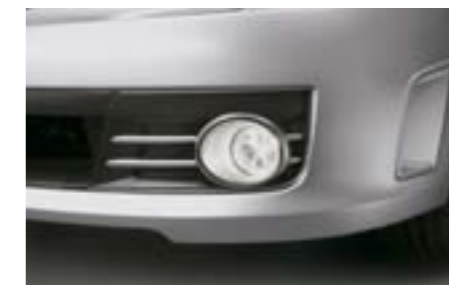
3 Kit antibrouillards H4510FG040 W Améliore le confort de vision par mauvais temps