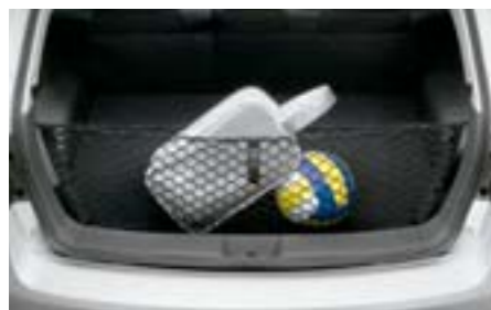
45 Filet d'entrée de coffre F551SFG100 W Pour un coffre bien rangé