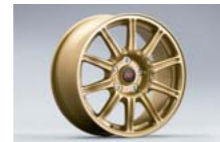
16 Jante aluminium 10 branches, Or (17") 28111FE192 W 8"x17" déport 53 entraxe 114,3 Pneu 235/45R17