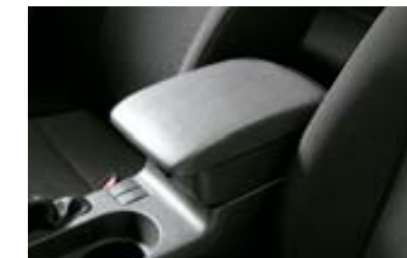
58 Réhausse de console centrale J2010FG000MG W