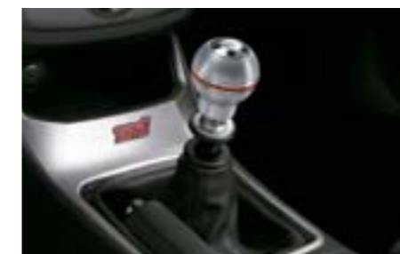
51 Pommeau de levier de vitesse sport; rouge (BVM6) C105EFG000 W