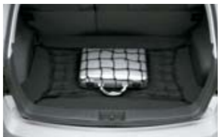
47 Filet de coffre (horizontal) F5510FG000 W Pour un coffre bien rangé