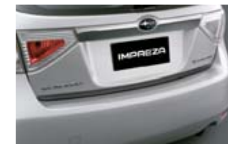
8 Enjoliveur de hayon design carbone E755EFG010 E Moulure façon carbone