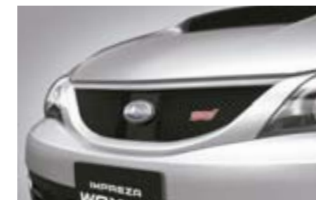
1 Grille de calandre sport (Type nid d'abeilles) J1010FG200NN W Calandre qui radicalise le look, avec logo STI *A peindre