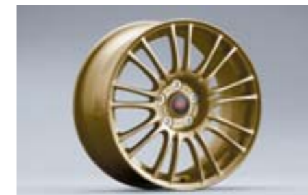
13 Jante aluminium 9 double-branches, Or (18") 28111FG060 W 8.5"x18" déport 55 entraxe 114,3 Pneu 245/40R18