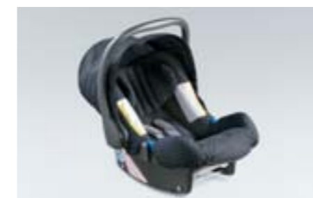
67 Siège enfant SUBARU Baby safe ISOFIX F410EYA103 W Installation sûre grâce au système ISOFIX, incluant un canopy