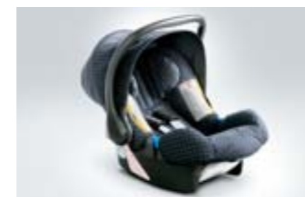
68 Siège enfant SUBARU Baby safe plus F410EYA102 W Incluant un canopy pour le soleil