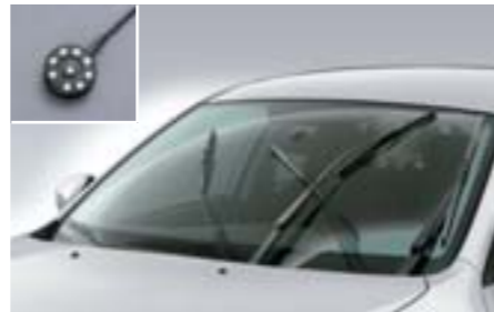
35 Kit de détection de pluie SEWAYA8000 E Améliore le confort d'utilisation par temps de pluie