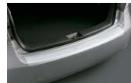
10 Bandeau de protection pare-chocs arrière transparent E775EFG100 W Protège en surface le dessus du pare-chocs des rayures