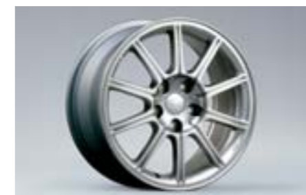
19 Jante aluminium 10 branches, Argent (17") 28111FE351 W 8"x17" déport 53 entraxe 114,3 Pneu 235/45R17