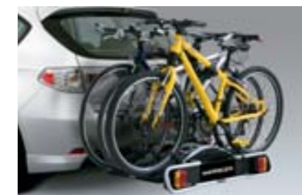
33 Porte vélos (3 vélos) E365EFG800 / E365EFG900 W Fixation sur attelage, Pour 3 vélos *Nécessite un attelage