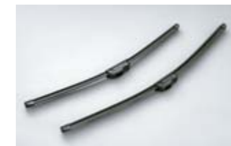
12 Essuie-glaces aérodynamiques SEBOFG8000 E Balais plats et aérodynamiques pour un essuyage plus performant