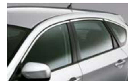
5 Moulures d'entourage de vitres chromées E755EFG100 W Pour une touche plus élégante