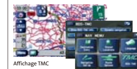
Affichage TMC Menu TMC