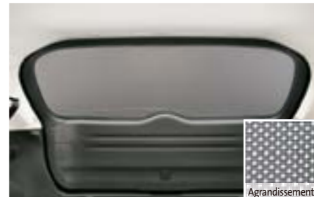
39 Pare-soleil lunette F505EFG000 W Protège des rayons du soleil, Structure en nid d'abeille