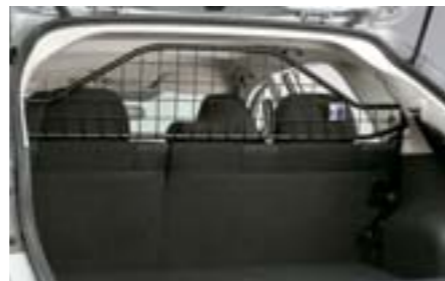
40 Grille de séparation en métal (K/M) F555EFG000 W Pour bien séparer le coffre des passagers arrières.