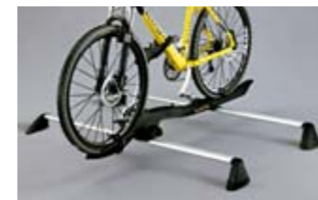
31 Porte vélo (barracuda) E361ESA501 W Design aérodynamique, Facilité d'installation *Nécessite les barres de toit