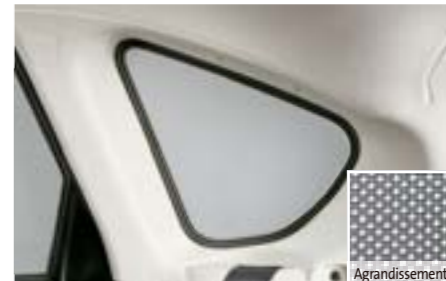
38 Pare-soleil custodes F505EFG100 W Protège des rayons du soleil, Structure en nid d'abeille