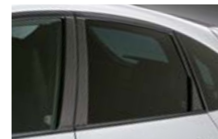
6 Décors montants de portes design carbone E755EFG300 E Moulures façon carbone