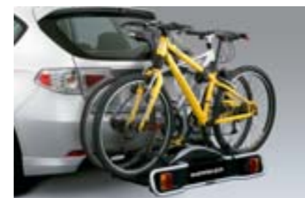
32 Porte vélos (2 vélos) E365EFG600 / E365EFG700 W Fixation sur attelage, Pour 2 vélos *Nécessite un attelage