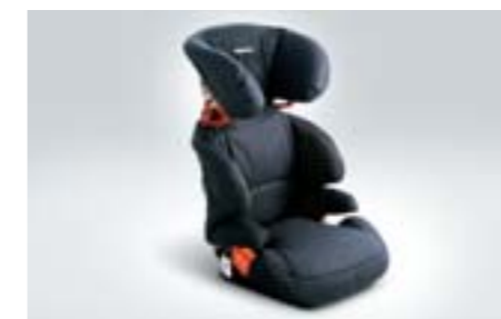
71 Siège enfant SUBARU Kid plus F410EYA212 W Protection supplémentaire en cas de choc latéral