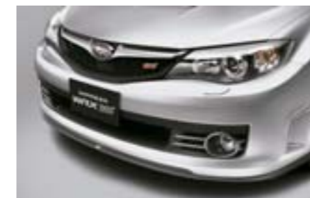
2 Lame de pare-chocs avant STI E2410FG120 W Jupe renforçant le caractère agressif du véhicule