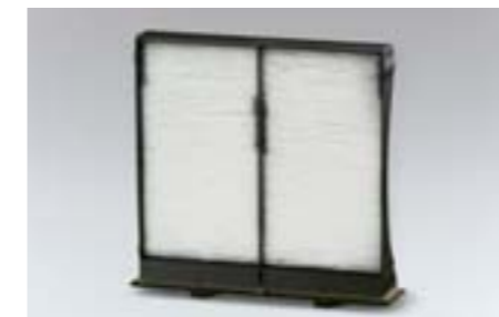
55 Filtre à pollen 72880FG000 W

Un confort certain par conduite de nuit *Nécessite le kit d'adaptation