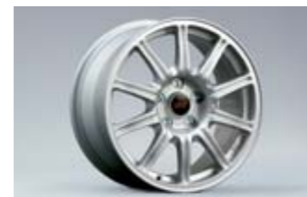
18 Jante aluminium 10 branches, Argent (17") 28111FE272 W 8"x17" déport 53 entraxe 114,3 Pneu 235/45R17