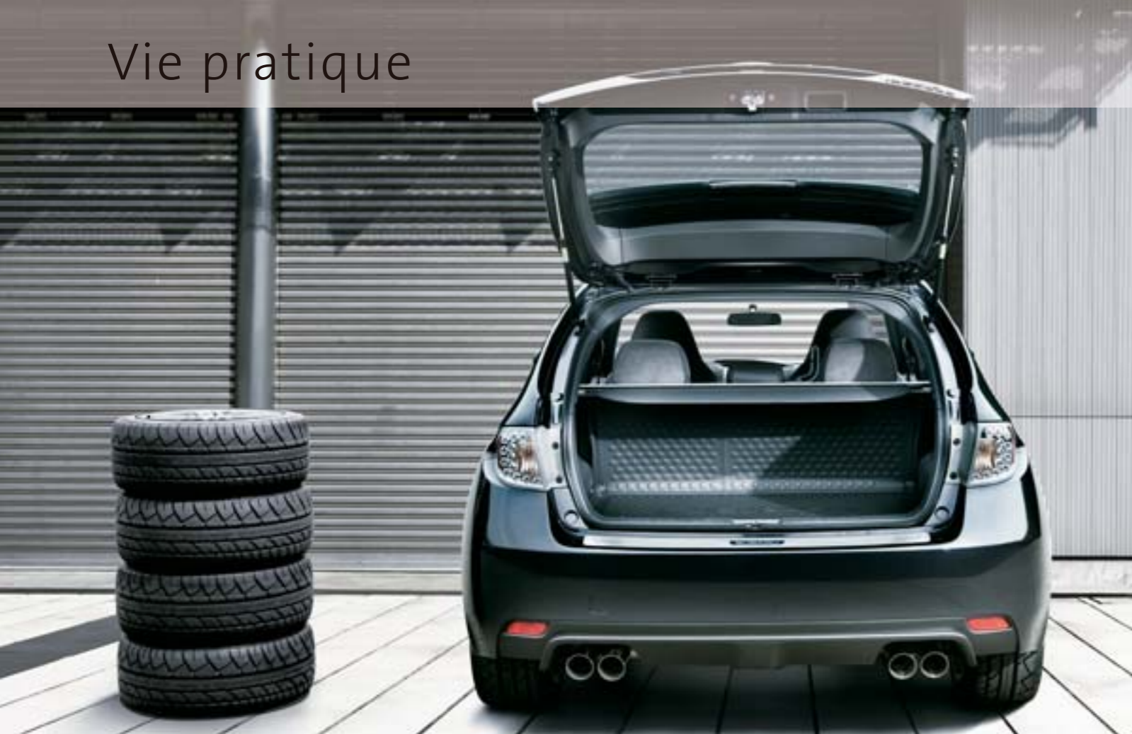
Photo: véhicule présenté avec un seuil de coffre chromé, et une protection de coffre escamotable.