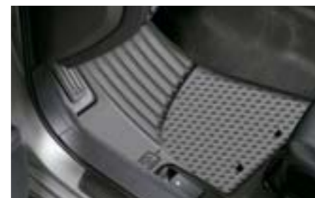
50 Jeu de tapis caoutchouc J505EFG000 W Pour résister à la boue et à la neige. *Jeu avant et arrière