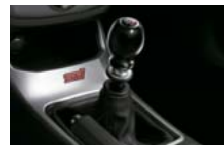
52 Pommeau de levier de vitesse, Duracon (BVM6) C1010FG400 W

Façonné à partir de Duracon pour plus de précision et de vitesse dans le passage des rapports. Plus léger et plus résistant que le modèle de série. *Duracon est une marque déposée par la société Polyplastics