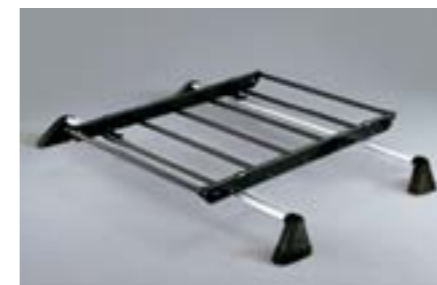
24 Galerie E361EAG700 W Accroît les possibilités de chargement *Nécessite les barres de toit