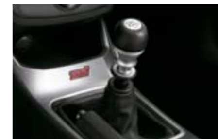
53 Pommeau de levier de vitesse aluminium et cuir (BVM6) C1010FG100 W

Façonné à partir de Duracon pour plus de précision et de vitesse dans le passage des rapports. Plus léger et plus résistant que le modèle de série. *Duracon est une marque déposée par la société Polyplastics