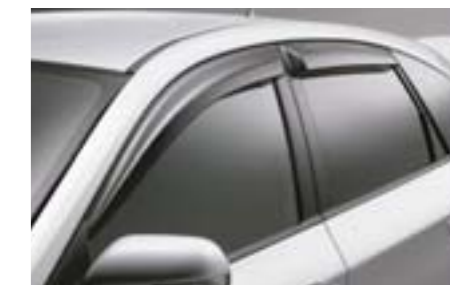
4 Déflecteurs de vitres latérales E3610FG000 W Permet l'ouverture des vitres pour mieux ventiler l'habitacle, même par mauvais temps