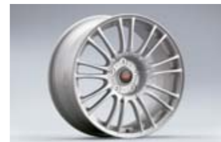
14 Jante aluminium 9 double-branches, Argent (18") 28111FG070 W 8.5"x18" déport 55 entraxe 114,3 Pneu 245/40R18