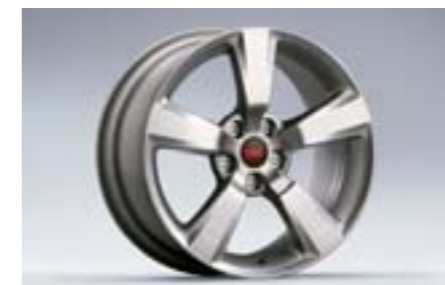
15 Jante aluminium 5 branches, Argent (18") 28111FG050 W 8.5"x18" déport 55 entraxe 114,3 Pneu 245/40R18