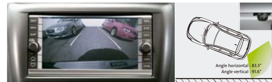
65 Caméra de recul arrière (aide au stationnement) H0010FG000 W Caméra haute résolution 250.000 pixels CCD qui affiche l'environnement à l'arrière du véhicule sur l'écran de la navigation, lorsque la marche arrière est enclenchée. Angle horizontal de 83,3° et un angle vertical de 91,6° *Nécessite une navigation