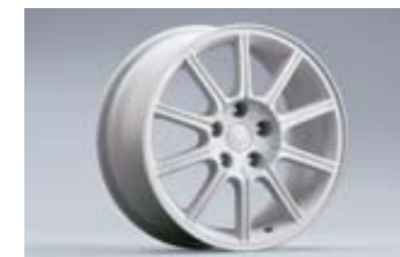
20 Jante aluminium 10 branches, Blanche (17") 28111FE361 W 8"x17" déport 53 entraxe 114,3 Pneu 235/45R17