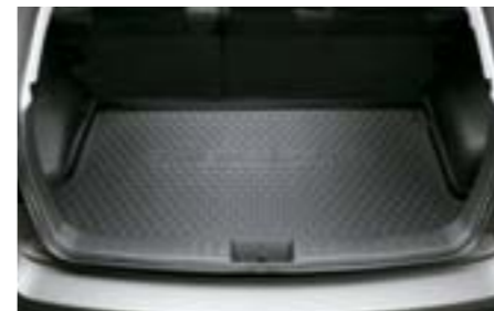
42 Protection de coffre en plastique J515EFG000 W Idéal contre la saleté et la boue