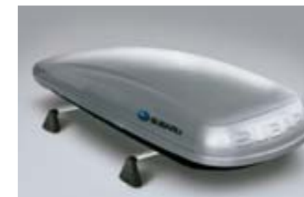
25 Coffre de toit (grand modèle) E361EYA900 W Dimensions: 2,267 x 805 x 355 mm. Volume: 430 litres. *Nécessite les barres de toit