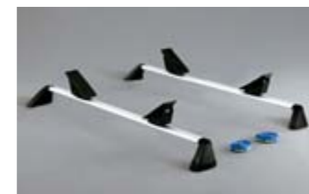
27 Porte kayak E361EAG600 W Pour 1 kayak. *Nécessite les barres de toit