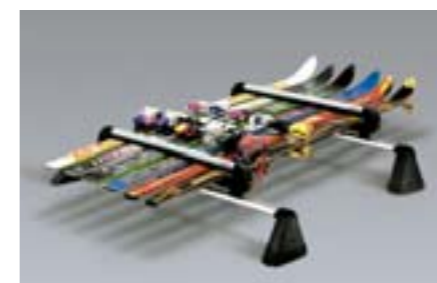
28 Porte skis (maximum 6 paires) E361EAG550 W Pour 6 paires de ski horizontales ou 4 surfs. Largeur utilisable: 640 mm. *Nécessite les barres de toit