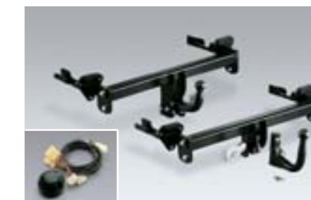
34 Attelage boule (amovible, fixe) Voir liste d'application W *La capacité de traction maximum varie d'un modèle à l'autre. Consulter le concessionnaire SUBARU le plus proche