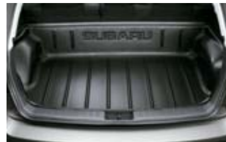
44 Bac de coffre J515EFG200 W Protection supplémentaire lors des chargements/déchargement d'objets encombrants