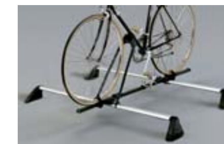
30 Porte vélo (standart) E361ESA701 W Adaptation parfaite sur les barres *Nécessite les barres de toit