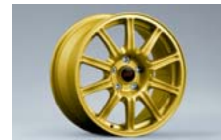
17 Jante aluminium 10 branches, Or (17") 28111FE321 W 8"x17" déport 53 entraxe 114,3 Pneu 235/45R17