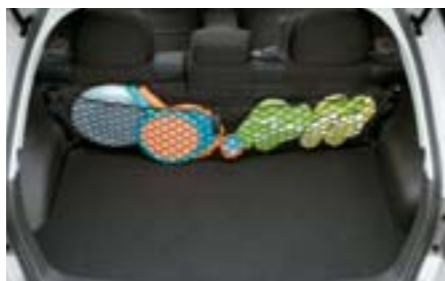
46 Filet de coffre (derrière le siège arrière) F551SFG200 W Pour un coffre bien rangé