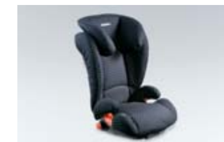
70 Siège enfant SUBARU Kid ISOFIX F410EYA213 W Installation sûre grâce au système ISOFIX. Protection supplémentaire en cas de choc latéral