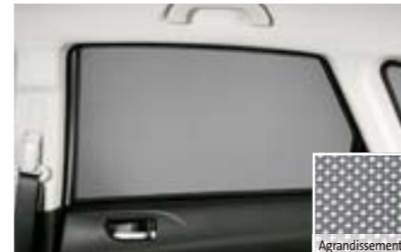
37 Pare-soleil vitres arrières F505EFG200 W Protège des rayons du soleil, Structure en nid d'abeille