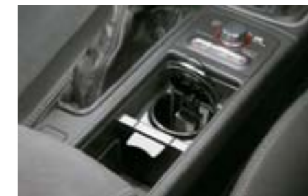
57 Cendrier F6010FG001 W

Remplace la prise accessoires en allume cigare