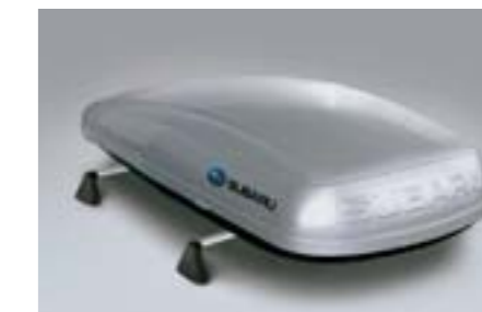
26 Coffre de toit (petit modèle) E361EYA801 W Dimensions: 1,792 x 797 x 355 mm. Volume: 380 litres. *Nécessite les barres de toit