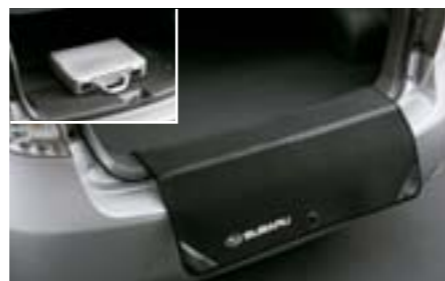
48 Protection de seuil de coffre repliable SEBCAG2000 E Protège le parechoc des rayures, et peut servir de tapis antidérapant