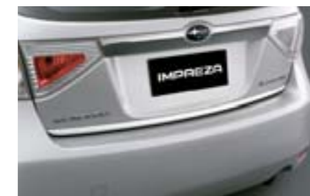
7 Moulure de hayon chromée E755EFG000 W Pour une touche plus élégante