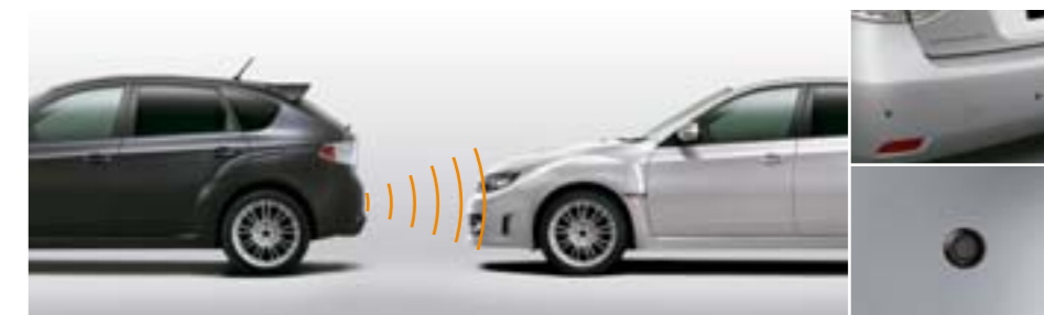
66 Système d'aide au stationnement (avant, arrière) SEWAFG2100, SEWAYA2000 E Avant : Pour se garer facilement, utilisant 4 capteurs. Signal audible, ne s'applique qu'à faible vitesse (manoeuvres). Arrière : Pour se garer facilement, utilisant 4 capteurs. Signal audible et visuel.