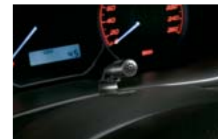
63 Micro pour kit mains libres H0018FG300 W Pour les véhicules équipés de la navigation d'origine *peut être installé avec le kit navigation H001EFG000