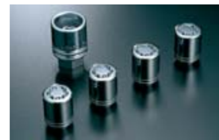
22 Jeu d'antivols de roues B327EYA000 W Pour lutter efficacement contre le vol de roues !