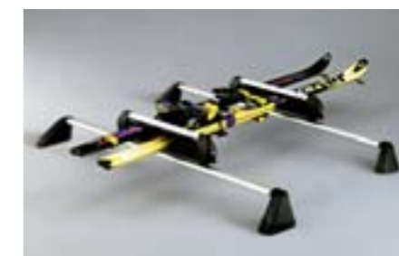
29 Porte skis (maximum 4 paires) E361EAG500 W Pour 4 paires de skis horizontales ou 2 surfs. *Nécessite les barres de toit