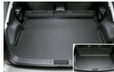
43 Protection de coffre en plastique repliable J515EFG100 W Idéal contre la saleté et la boue, et protège le dossier des sièges arrières