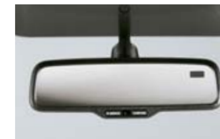
54 Rétroviseur photochromatique H501SFG000 W

Nouveau pommeau, permettant un meilleur grip et contrôle des vibrations, pour répondre à vos exigences en matière de perfection.