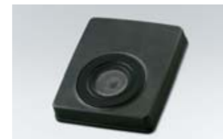
61 Caisson de basses H630SFG000 W Ajoute une puissance de 120 W, sensations garanties