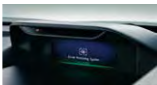
Système de contrôle du conducteur