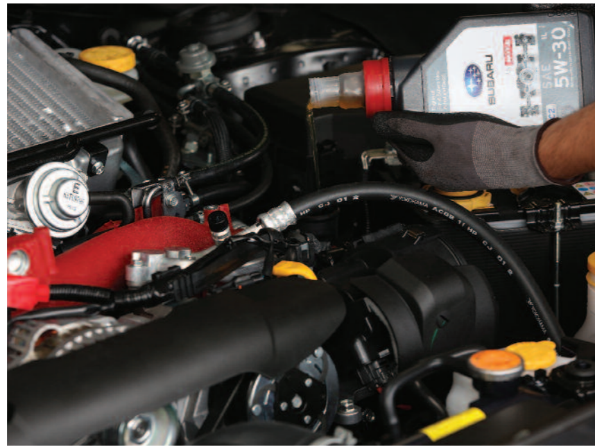
Pour les simples opérations de vidange, les techniciens appliquent une procédure bien précise et emploient un lubrifiant Motul spécialement développé pour Subaru France.