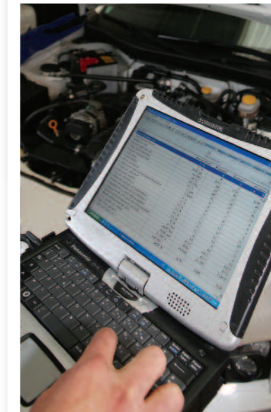
Aucun secret ne peut résister à la valise de diagnostic "Subaru Select Monitor 3".