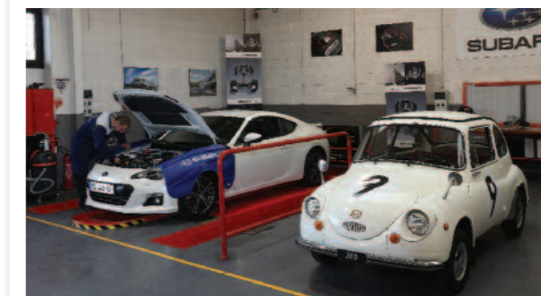
Première voiture construite par la marque en 1958, la petite Subaru 360 est toujours vaillante. La preuve d'une fiabilité sans faille et d'un entretien bien suivi !